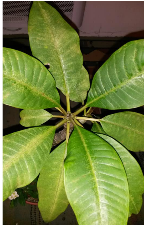
frangipanier infecté par des araignées rouges